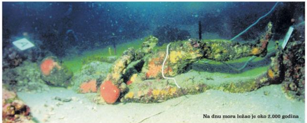
Na dnu mora ležao je oko 2.000 godina

Ubrzo ga je struka identificirala, rekla da se radi o apoksiomenu, a to je antički atleta koji nakon natjecanja čisti tijelo. Malo potom dobiva vlastito ime, postaje Apoksiomen! Za sva vremena. Kroz godine