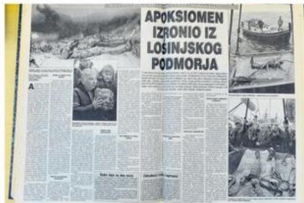
Duplerica posvećena povijesnom vađenju kipa u Novom listu

Nešto dalje od mjesta pronalaska otkriveni su određeni tragovi što bi mogli ukazivati na brodolom iz antičkih vremena. O tome je nedavno u časopisu Pomorac pisao Dubravko Balenović, istaknuti podvodni ribolovac i ronilac, bez sumnje jedan od najboljih poznavatelja lošinskog podmorja. Njegovo je razmišljanje potpuno suprotno. Citiram dio teksta naslovljenog: »Kamo je plovio Apoksiomen?« U njemu, između ostaloga, stoji: »Jednostavno je nemoguće