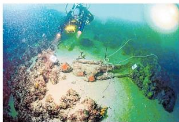
Kip na morskome dnu prije operacije vađenja