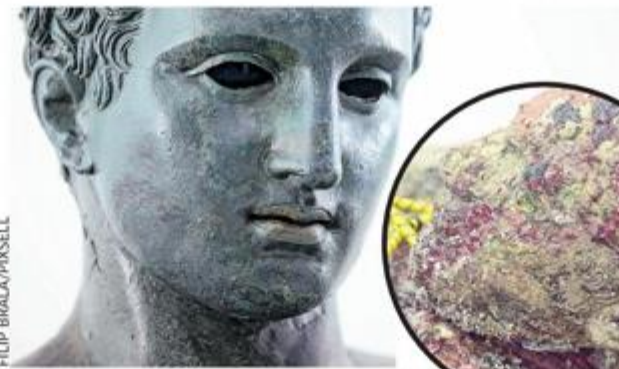
Apoksiomen nakon restauracije