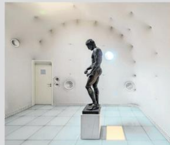
Apoksiomen u svom domu u muzeju u Malom Lošinja

Palača Kvamer, kako je ranije nazivan taj objekt u malolo-