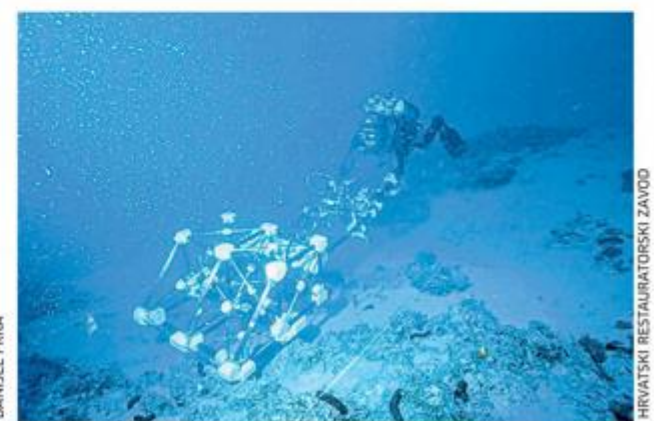
Rad detektorom velikog dometa