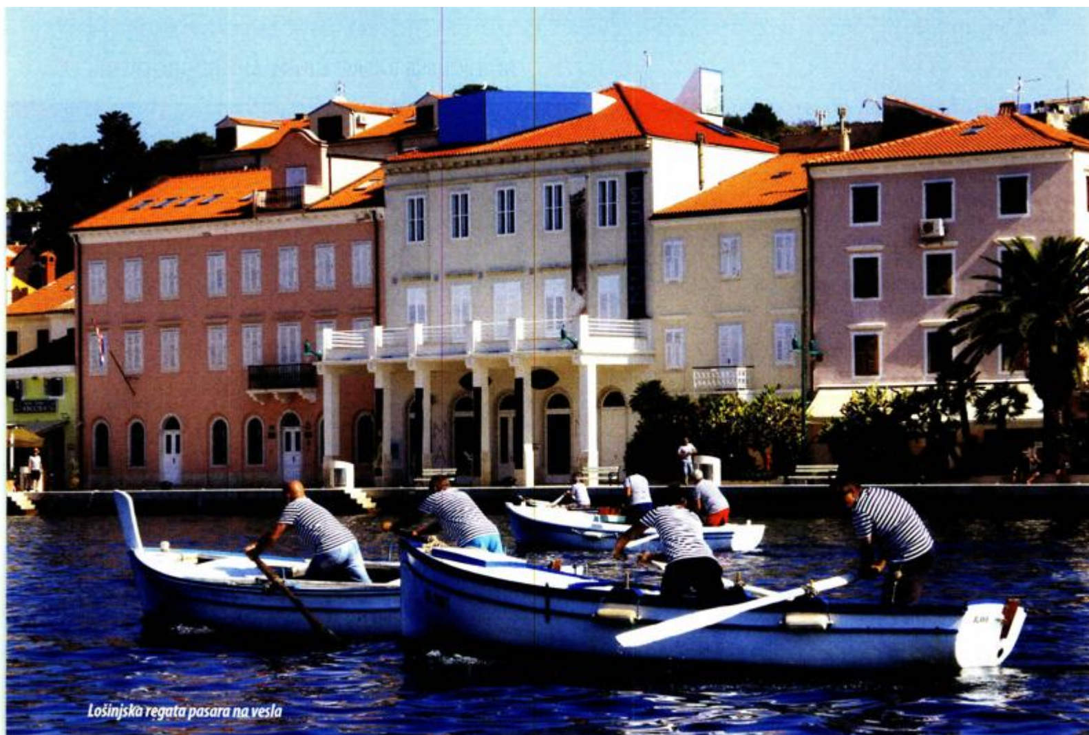
Lošinjska regata pasara na vesla

nastupom mažoretkinja, orkestra i klape, kao i prikazom tradicijskih pomorskih vještina i zanata. Mnogi su ljudi tada po prvi puta vidjeli što je to kalafatanje, kako se plete mreža, izrađuju vrše, a neki su naučili i vezati poneki mornarski čvor!