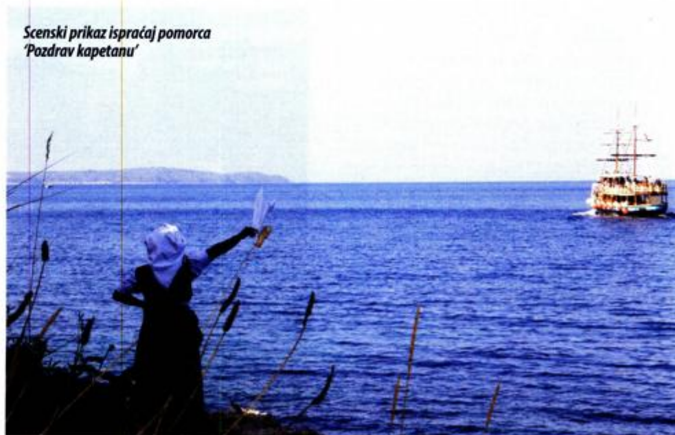
Scenski prikaz ispraćaj pomorca 'Pozdrav kapetanu'

Tijekom festivala, zahvaljujući Gradu Malom Lošinju, Turističkoj zajednici te brojnim partnerima, svim posjetiteljima