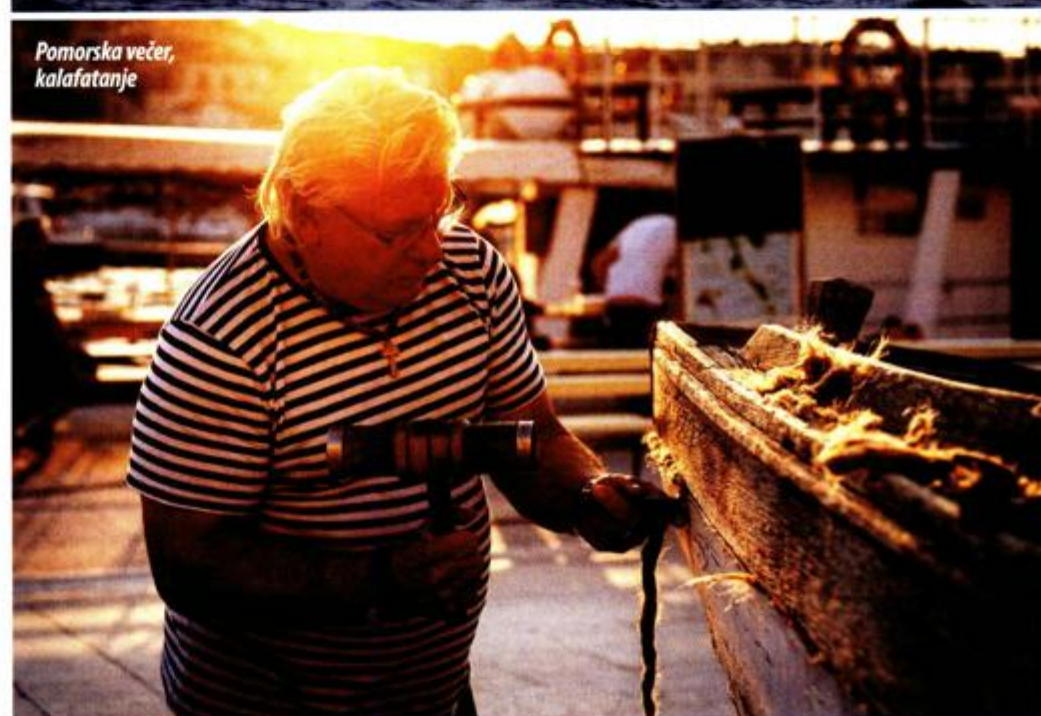
Pomorska večer, kalafatanje