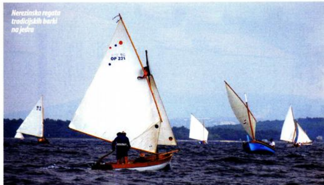
Nerezinska regata tradicijskih barki na jedra

Pomorska večer, održana u centralnom tjednu festivala, duž Rive lošinjskih kapetana oduševila je sve prisutne bogatom gastronomskom ponudom na izletničkim brodovima,