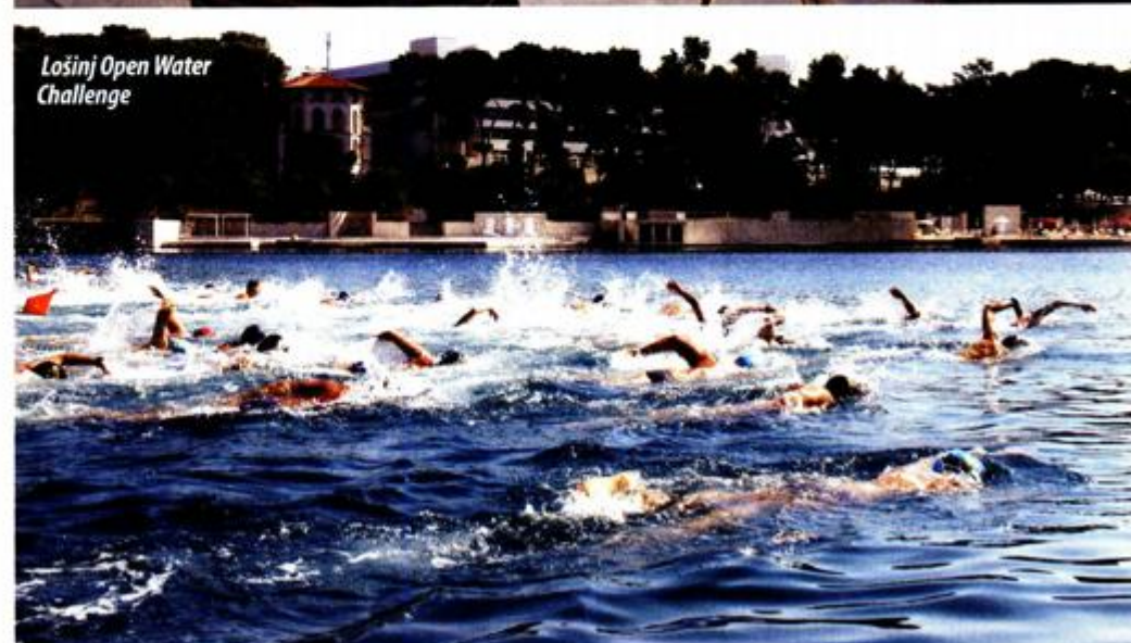
Lošinj Open Water Challenge