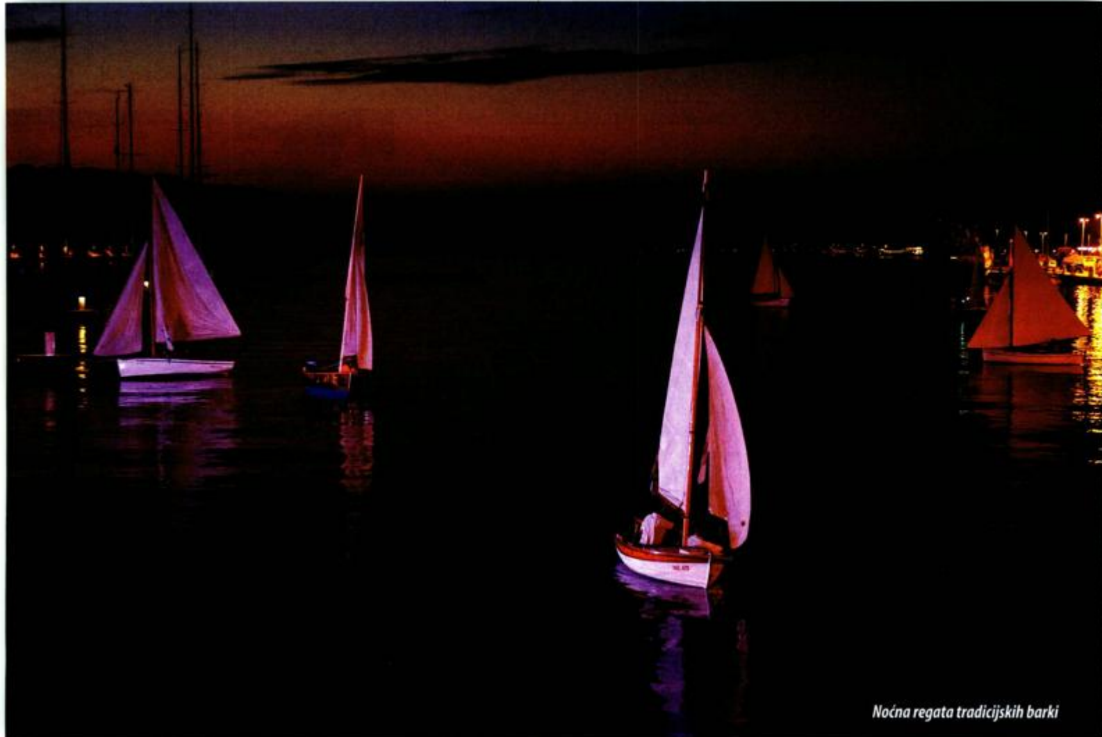
Noćna regata tradicionalnih barki