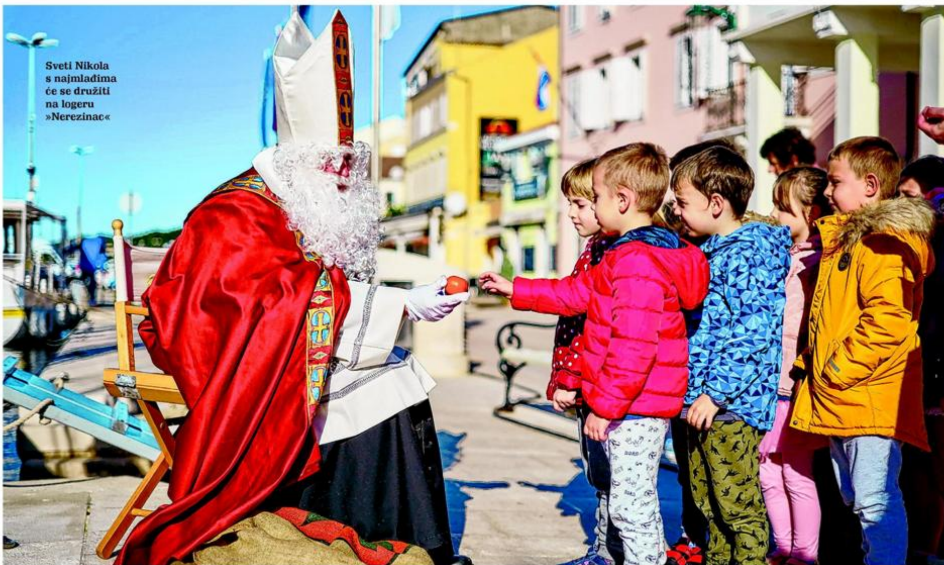
Sveti Nikola s najmlađima će se družiti na logeru »Nerezinac«