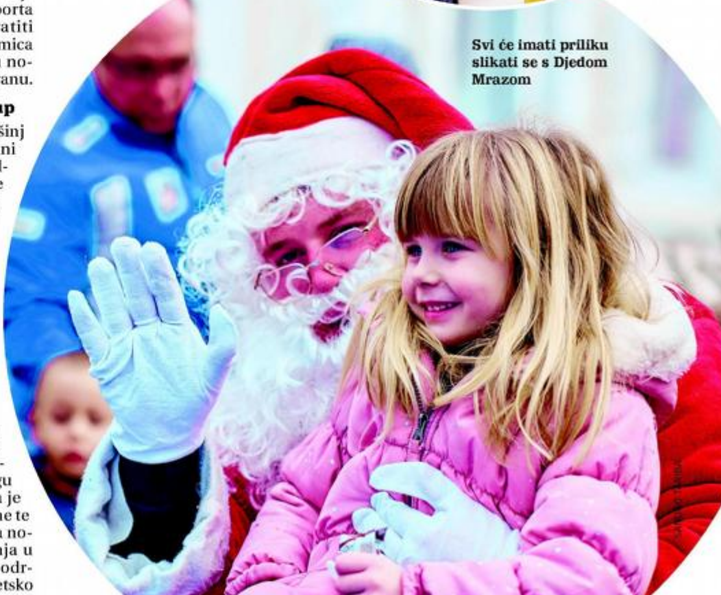
Svi će imati priliku slikati se s Djedom Mrazom