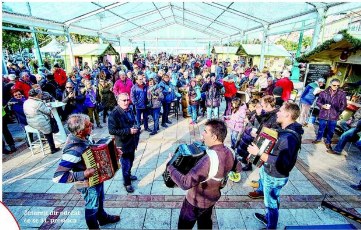
Jutarnji dir održat će se 31. prosinca

Kako najbolje dočekati Novu godinu – svi zajedno!