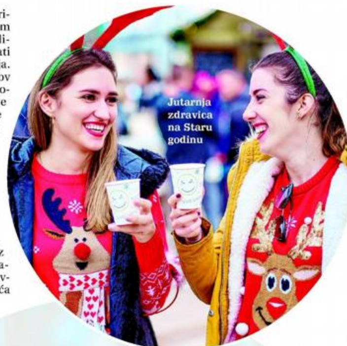
Jutarnja zdravica na Staru godinu

Badnje jutro na otoku bit će posebno za one najmlade. Na malološinjskom trgu organiziran je prigodni program i animacija za djecu. Bojenje božićnih kuglica, crtanje, ples i zabava uz animatore priuštiti će malenima nezaboravan doživljaj. Brudeti i druga domaća prigodna jela tog jutra moći će se također