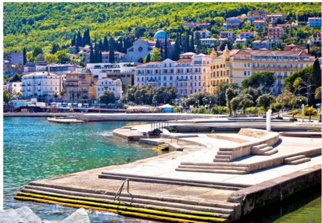
Opatija bajna je kvarnerska top destinacija u kojoj turistička sezona traje cijele godine