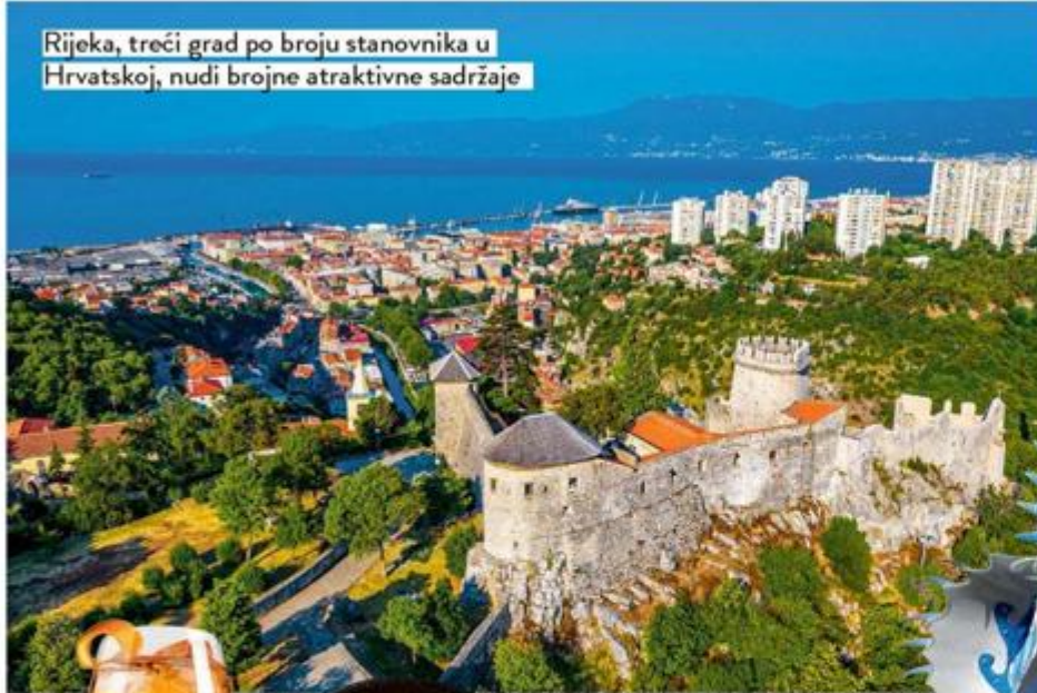
Rijeka, treći grad po broju stanovnika u Hrvatskoj, nudi brojne atraktivne sadržaje