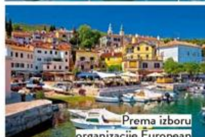
Prema izboru organizacije European Best Destinations, Volosko je uvršteno među najljepše skrivene dragulje u Europi

Tako blizu, a tako drukčije od svakodnevice - Kvarner je regija bogata raznolikim turističkim sadržajima, bilo da se želite odmoriti, zabaviti, uživati u luksuznom hotelskom smještaju ili aktivno provesti vikend baveći se raznim tjelesnim aktivnostima. Čistom prirodom, bogatom florom i faunom, uređenim šetnicama, vidikovcima s kojih se pruža nezaboravan pogled i tirkiznim morem koje osvaja i domaće i strane slavne osobe. Kvarner obuhvaća Opatijsku rivijeru, Rijeku i riječki prsten, Crikveničko-vinodolsku rivijeru te otoke Krk, Cres, Lošinj i Rab.