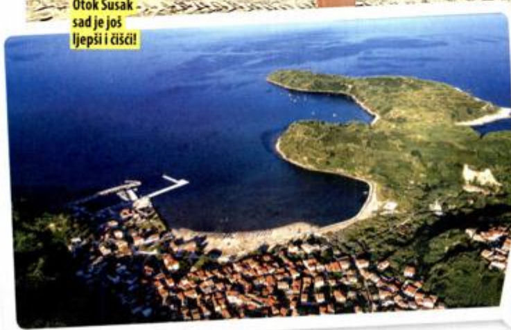
Otok Susak sad je još ljepši i čistiji!