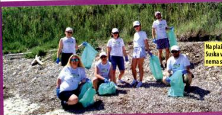
Na plažama Suska više nema smeća!