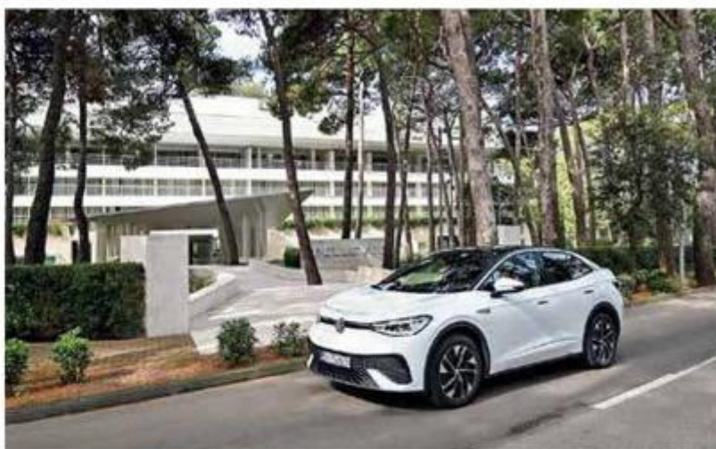
Hotel Bellevue, prvi s pet zvjezdica na Lošinj, visoko je podigao standarde odmora svojim ambijentom i ponudom