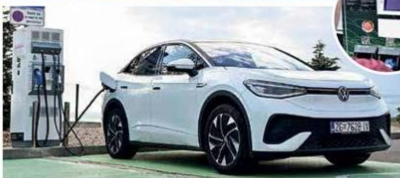
Od pomoći nam je bila kartica We Charge prihvaćena kod 950 distributera u 28 europskih zemalja, koja trenutno pokriva više od pola milijuna punionica električnom energijom

južnom rubu Malog Lošinja prije 20 godina je osmislila Sandra Nicolich.