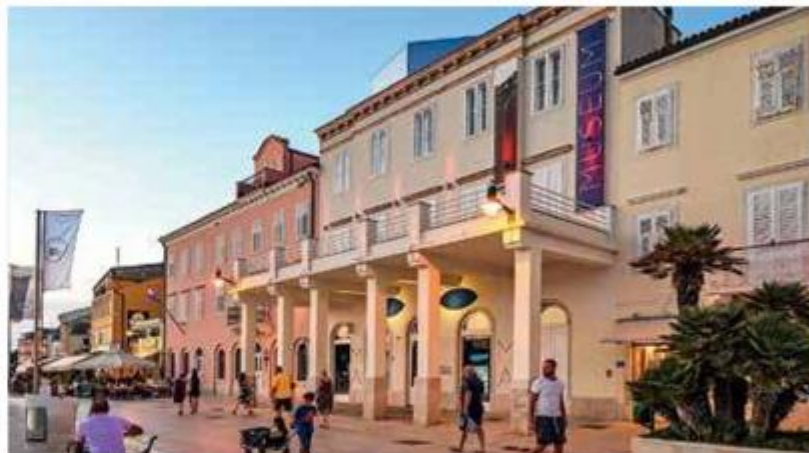
Nakon restauracije, a potom i turneje Hrvatskom i najvažnijim muzejima svijeta, Apoksiomen se nakon 16 godina od izranjanja iz mora skrasio u jedinstvenom muzeju na lošinjskoj rivi