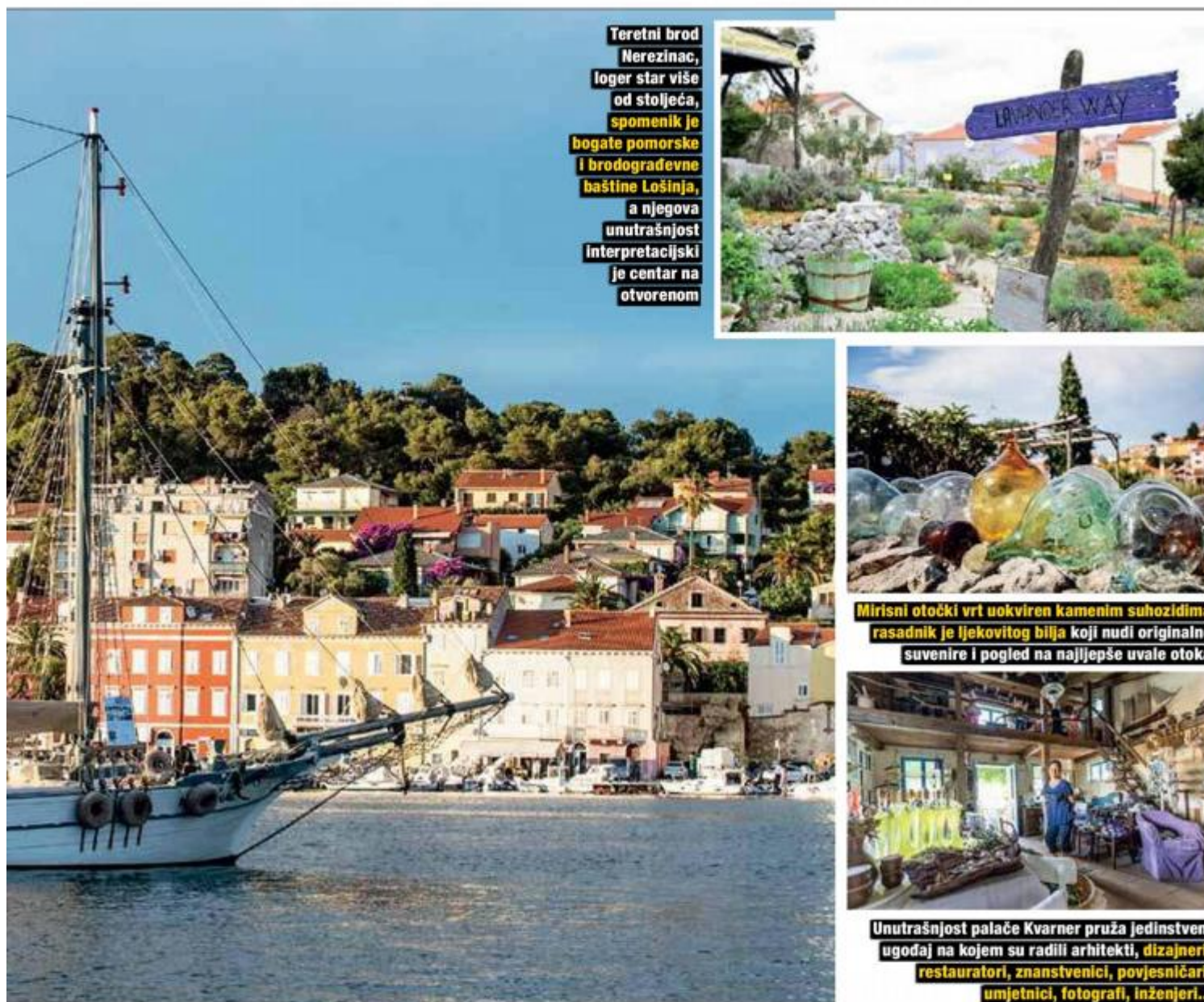
Teretni brod Nerezinac, loger star više od stoljeća, spomenik je bogate pomorske i brodograđevne baštine Lošinja, a njegova unutrašnjost interpretacijski je centar na otvorenom