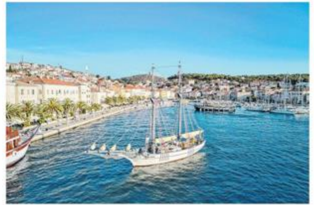
Loger »Nerezinac« zaštitni znak lošinjskog pomorstva