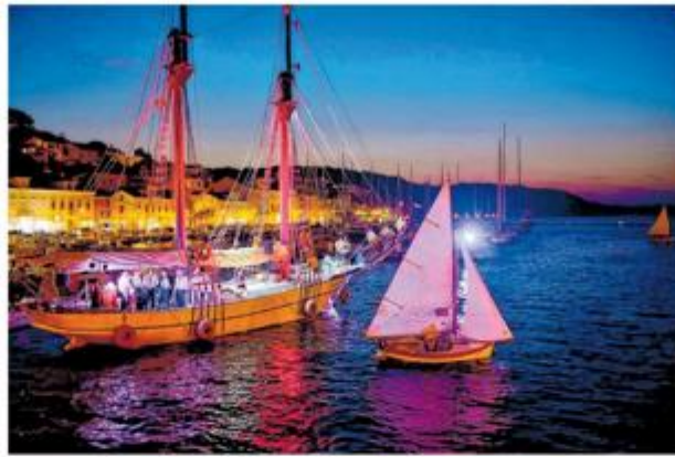
Noćna regata tradicijskih barki na rasporedu idućeg tjedna