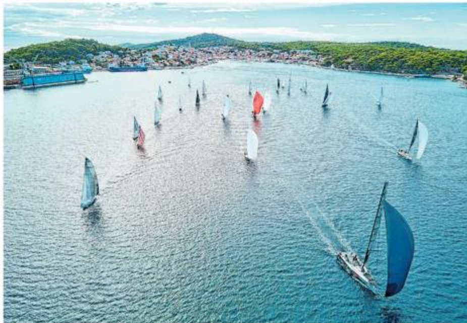
Idućeg vikenda održat će se i Lošinjaska regata olimpijaca

Niz regata nastavlja se i idućeg vikenda. Romantičan ugodaj stvorit će već idućeg petka, 8. rujna, 6. Noćna regata tradicijskih barki na jedra pod svjetlima reflektora u