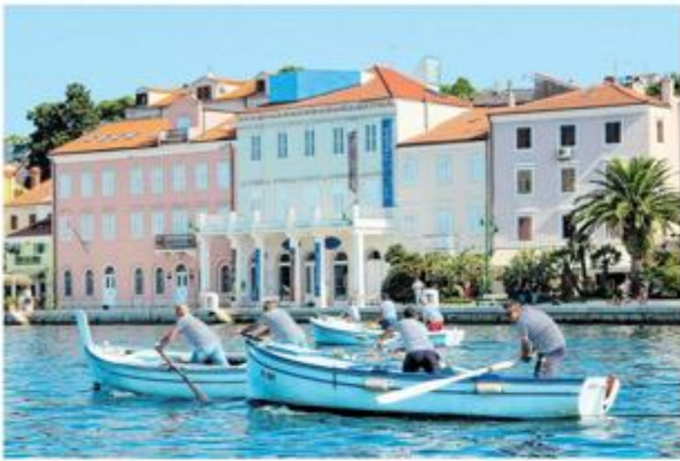
Lošinjska regata pasara na vesla danas otvara manifestaciju