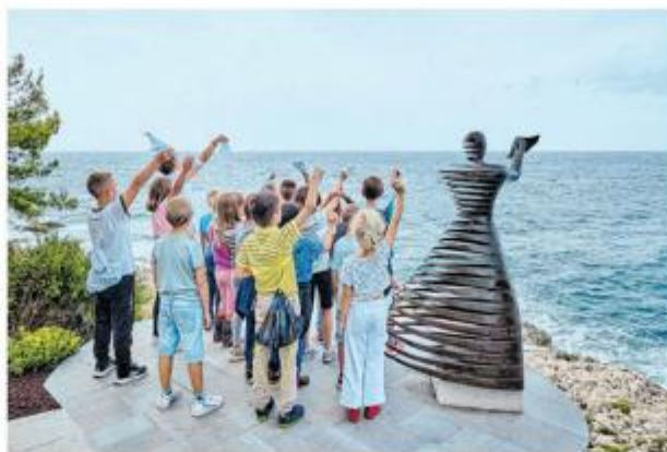
Kod skulpture »Addio« bit će uprizorenje ispraćaja pomoraca