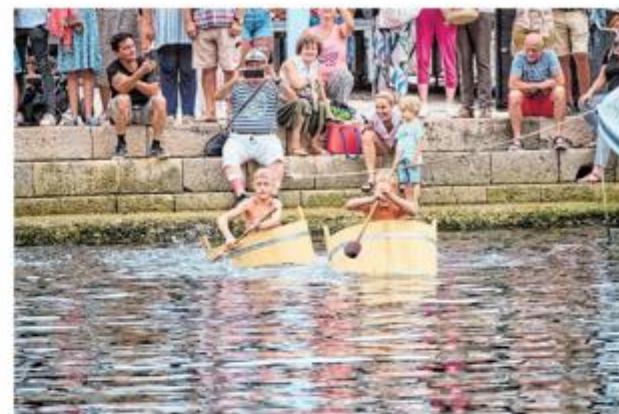
Može li se ploviti u bačvi, pokazat će Veloselska regata maštela