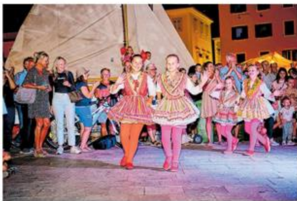
Pomorska večer iduće subote okupit će folklorna društva