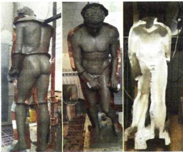
Apoksiomen – rad po etapama

očistiti, a to može učiniti bilo tko, može »teta čistačica«, to neće biti posao koji iziskuje posebno stručno znanje. Dovoljna je krpica i, eventualno, neko ne pretjerano agresivno sredstvo i jednostavno ga se pobriše, rekla je Obad. S obzirom na materijal od kojega je napravljen ni eventualna oštećenja, primjerice ogrebotine, neće stvarati nikakve probleme jer se i one jednostavno mogu popraviti.