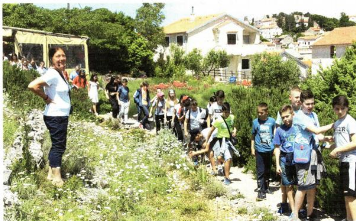
Moći će se naučiti mnogo toga o otočnom bilju, njegovim blagodatima, izradi prirodne kozmetike i ljekovitih pripravaka

A romaterapija, zdravlje, vitalnost te upotreba lokalnog bilja u svakodnevnom životu i prehrani teme su 7. Festivala vitalnosti »Apsyrtes« koji će se održati od 18. do 25. svibnja 2019. godine na otocima Cresu i Lošinju.