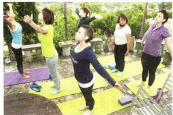
U zdravom tijelu zdrav duh

Posjetitelji te zaljubljenici u aromaterapiju i prirodu moći će uživati i sudjelovati u brojnim aktivnostima – besplatnim radionicama, edukacijama, predavanjima i treninzima te tretmanima, zdravim napitcima i zdravim zalogajima po promotivnim cijenama