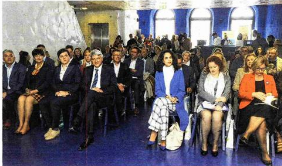
Zaključna konferencija projekta Mala barka II