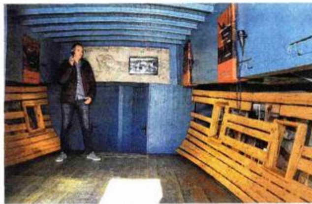
Muzeološki postav upućuje na značajke svakodnevnog života na brodu krajem 19. st.

projekta Mala barka 2, Primorsko-goranske županije, Ministarstva turizma, Grada i TZG-a Malog Lošinja, kao i iz donacija. Svakako, ne treba izgubiti iz vida da je ini-