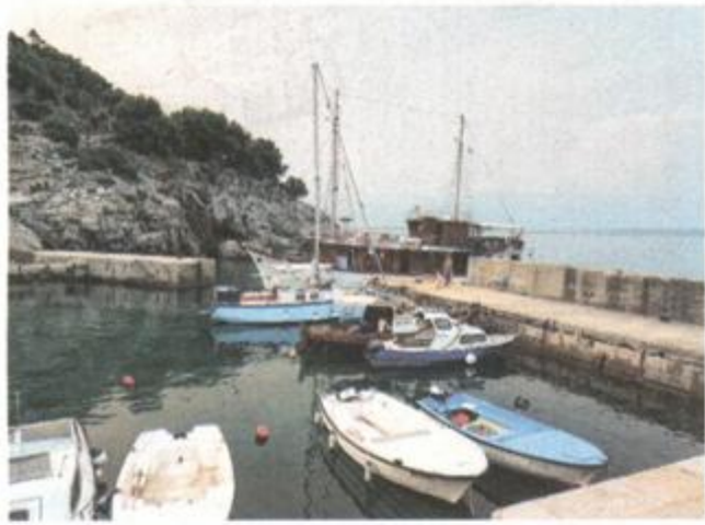
Lučica u Belom