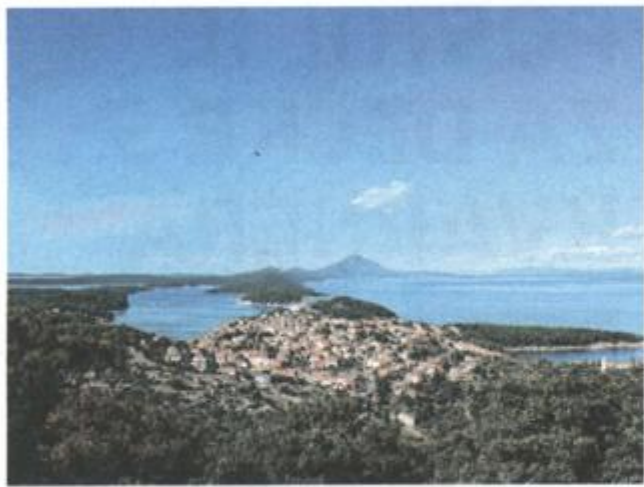
A što tek reći o akvatoriju Malog Lošinja