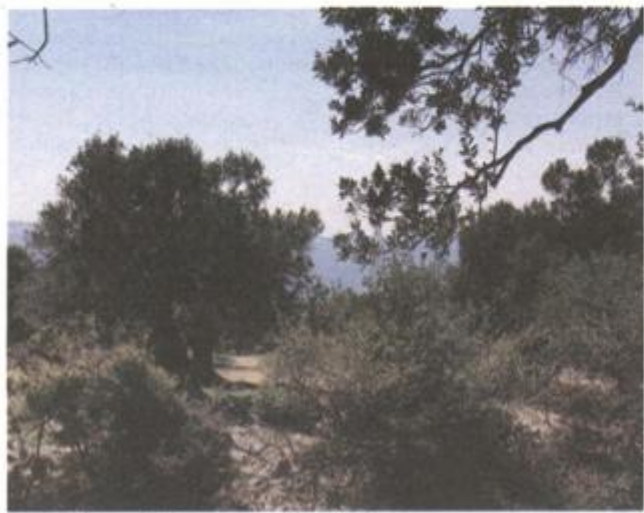
Lun i njegovi čudesni maslinici