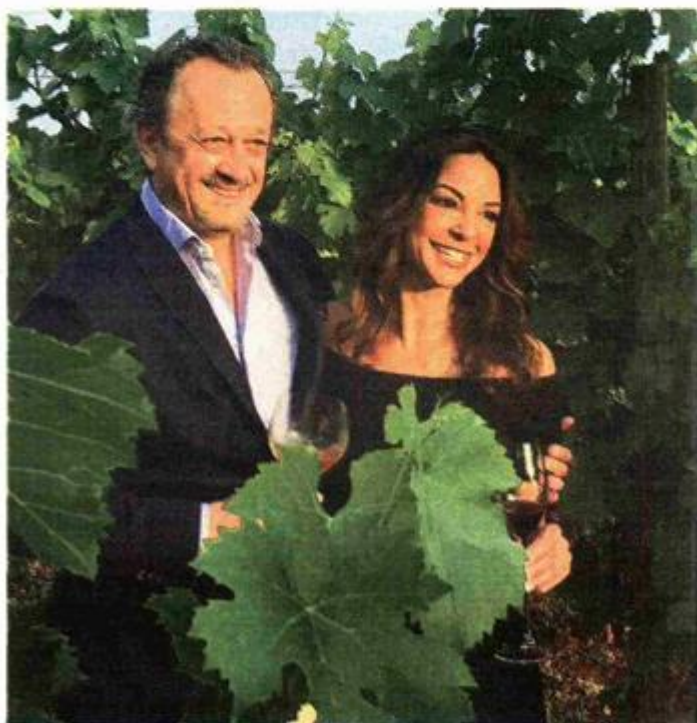
Eva LaRue s Miroslavom Plišom

P oznata glumica, manekenka i travel blogerica Eva LaRue, znana ponajviše po svojoj ulozi detektivke Natalije Boa Vista u seriji CSI Miami, od prekjučer ponovno boravi u Istri. S ovom simpatičnom hollywoodskom zvijezdom družili smo se u Wine hotelu Meneghetti kraj Bala, u kojem je Eva odsjela na početku svog gotovo dvotjednog