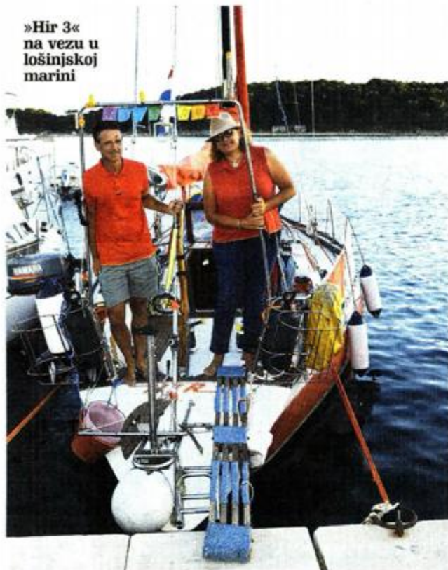
»Hir 3« na vezu u lošinjskoj marini