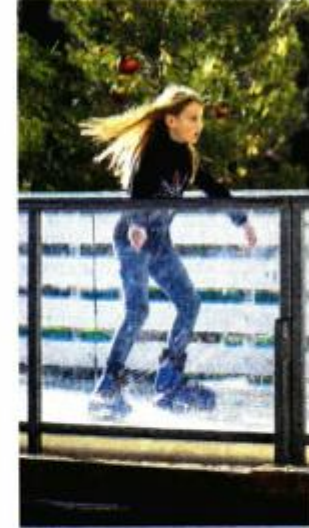
Vanjska ledena staza hit

Prve tri godine bila je organizirana škola klizanja koju su prošla brojna djeca i poneki razredi u okviru nastave tjelesnog odgoja pa se može reći da su brojni mali Rabljani sada već sasvimiskusni i solidni klizači. Ipak i oni su, skupa s brojnom publikom, s divljenjem pratili već tradicionalnu predstavu koju je klizački klub »Medo« iz Zagreba održao uoči Božića na rapskom ledu. Članovi Eko grupe OŠ Ivana Rabljanina, koja je lani u eko kvizu održanom na Krku osvojila vrijedno drugo mjesto, imali su pak priliku na Staru godinu naklizati se do mile volje jer im je njihov sponzor, Komunalna tvrtka Dundovo, omogućila besplatno klizanje ispod šatora. Istu »nagradu«