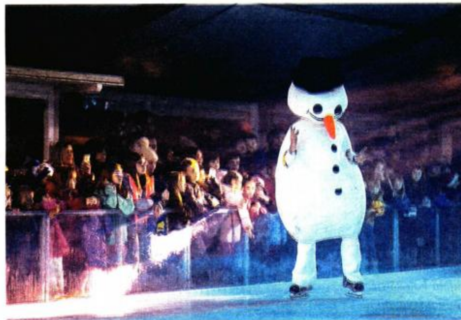
Predstava na ledu očarala mališane

Ukupno je lošinjsko klizalište ove zime otvoreno mjesec dana, a kako neslužbeno doznajemo, za sljedeću godinu organizatori planiraju klizašku sezonu produljiti za nekoliko dana, odnosno nešto ranije postaviti (nešto veće) klizalište, i to na suprotnoj strani trga.