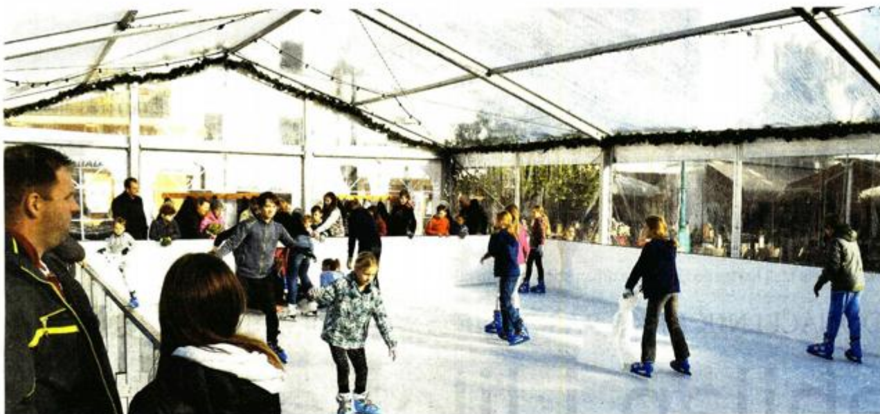
Prizor s lošinjskog klizališta