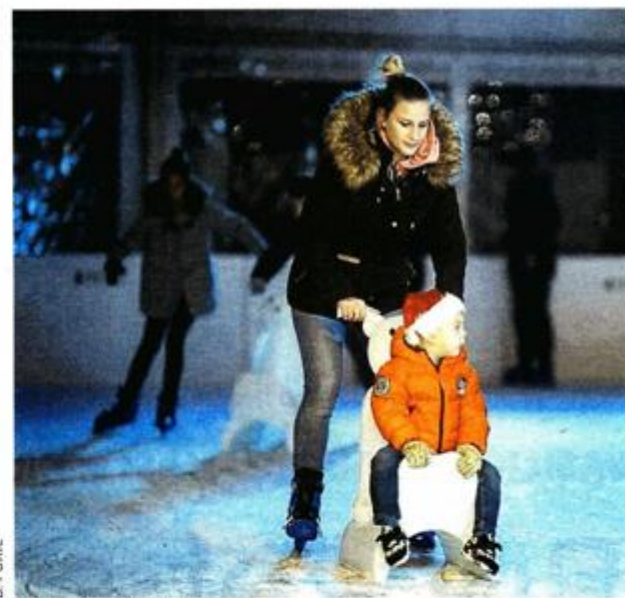
Može i bez klizaljki