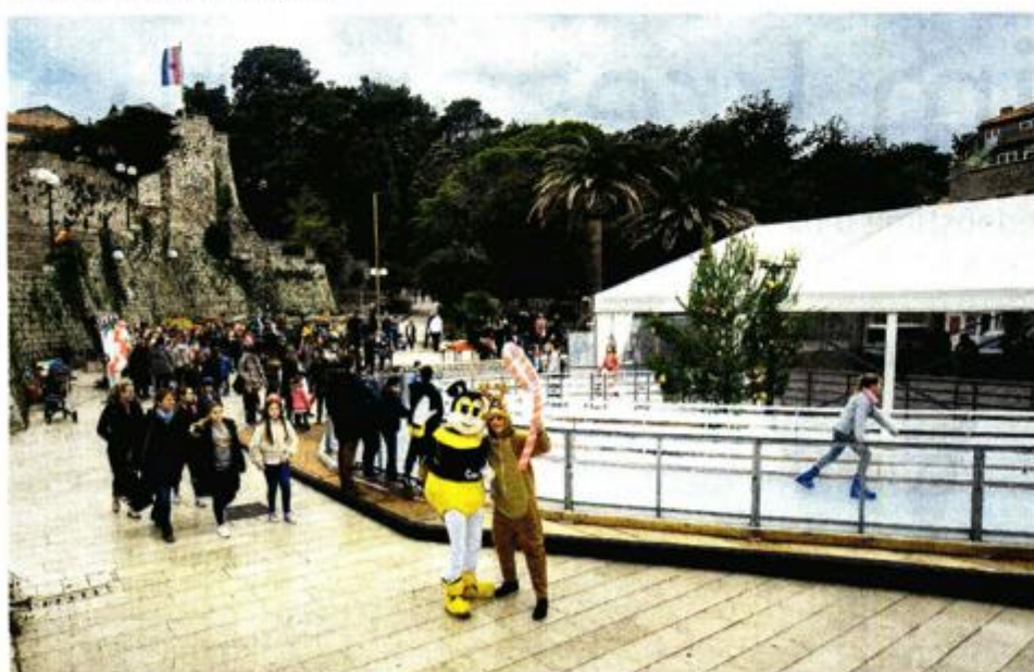
Rapsko klizalište ove godine na novoj lokaciji i u većim gabaritima