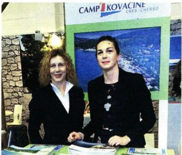
Cres, osim sunca i mora, obećao i nova iskustva i doživljaje