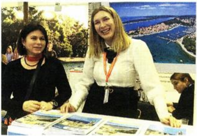
»Otok sreće« mami goste ponudom i – osmjesima

cijativa organizacija Green Destinations, TravelMole, Destination Stewardship Center, Asian Ecotourism Network (AEN) te Globalnog vijeća za održivi turizam (GSTC). Za ulazak u Top 100 održivih destinacija svijeta bilo je potrebno zadovoljiti 15 glavnih kriterija koji destinaciju čine odgovornom i zelenom, i to po temama: priroda i pejzaž, klima i okoliš, kultura i tradicija, ljudi i gostoljubivost te održivi destinacijski menadžment, koji i čine bit zelenog destinacijskog standarda. Ocjenjivačku komisiju sačinjavao je Ekspertni tim Top 100 održivih destinacija te Top 100 održivih destinacija selekcijski panel u sastavu 40 međunarodnih top stručnjaka u turizmu i održivosti. Certifikatom Top 100 održivih destinacija u svijetu, Mali Lošinj postao je dijelom najveće zelene destinacijske zajednice u svijetu u TOP 100 održivih destinacija svijeta u 2016. i 2017. godini.