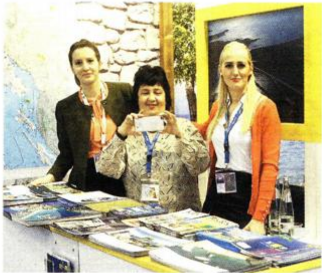
»Zlatni otok« pripremio bogat promotivni materijal na svome štandu

Lošinj se nije samo predstavljao na sajmu u Berlinu – »otok vitalnosti« je i nagrađen. Na ovogodišnjem sajmu ITB u Berlinu održana je dodjela nagrada za najbolje od Top 100 održivih destinacija svijeta među kojima je drugo mjesto dobio upravo Lošinj i to u kategoriji »Best of the Planet« – »Best of Mediterranean«. »Top 100 održivih destinacija svijeta« zajednička je ini-