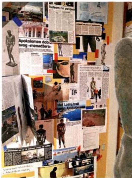
U muzeju se kat po kat, sobu po sobu, otkriva dio priče o čudesnom kipu iz 1. stoljeća pr. Kr.