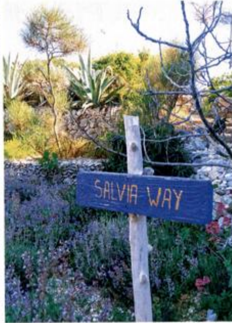
U Miomirisnom otočnom vrtu na 3500 četvornih metara nalazi se više od 450 vrsta samoniklog bilja, od čega više od 100 autohtonih

dijelu koji je uvijek vidljiv kad izlaze na površinu udahnuti zrak. Lošinjski dupini danas su jedna od najbolje istraženih skupina u cijelom Mediteranu, a iz Velog se može uputiti na izlete i uživo iz brodice vidjeti njihov razigran ples i igru. Pomalo spektično pitamo koliko izletnika doista i vidi dupine na tim izletima. - Više od 90 posto - spremno odgovara direktor TZ-a Cvitković te dodaje da se, ako na izletu dupini izostanu, ide ponovo sljedeći dan, dok ih turist ne vidi. Prepuni dojmova, poželjeli smo pauzu uz hladno piće i napravili su na možda najljepšem mjestu na otoku, pa čak i Jadranu. Autom smo se popeli iznad Malog Lošinja, na tematski vidikovac Providenca. Providenca objedinjuje 300 metara dugu poučnu stazu Apsyrtydes i vidikovac bar s lokalnim delicijama. Pogled je zadivljujući. U podnožju je Mali Lošinj okupan kasnoposlijepodnevnim suncem, u daljini su otočići arhipelaga. Kakvo divno mjesto za završetak divnog dana.