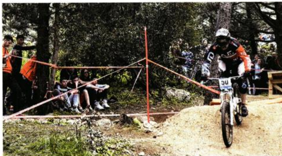
Natjecanja mountain-bikera u Velom Lošinj posljednjih godina plijene pozornost

ćem stanju trebalo prilagoditi, što nadograditi. Predložili su dodatne trail-centre. Išli smo u dogovor sa svim partnerima u destinacijama, napravili sastanke; od predstavnika smještajnih objekata, preko lovaca i Plavog svijeta do ostalih. Ideja je bila da se najprije radi na prometnom rješenju, budući da na terenu već imamo veliki broj biciklista, da vidimo na koji se način može regulirati njihov promet, a dugoročno bi se radilo na uređenju staza uz more, gdje je moguće. Potom ide izgradnja trail-centara. Ideja Švicaraca je da se ulaže u staze, ali i cjelokupni branding destinacije – edukacijom, poboljšanjem smještaja za bicikliste, poboljšanjem servisa, usluge rentiranja bicikala, a osim prijevoza busom, da se radi i »boat-shuttle« za male oto-