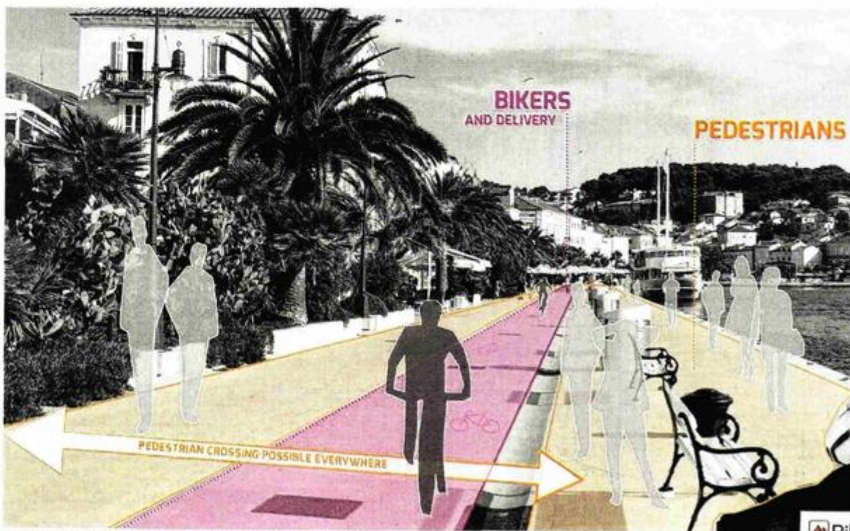
Prikaz biciklističke staze na Rivi lošinjskih kapetana