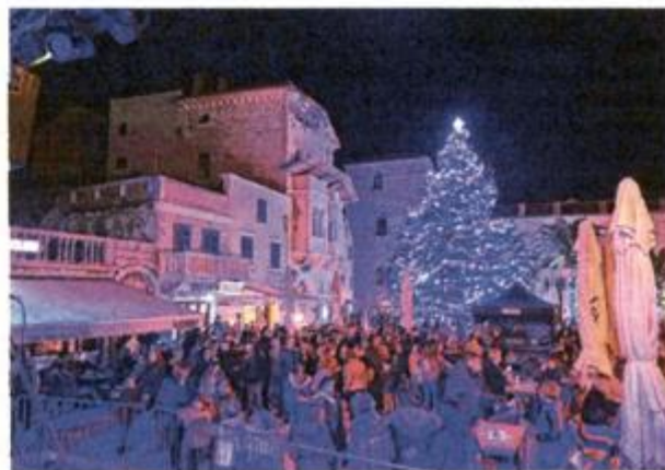
Otvaranje Adventa na Rabu privuklo mnoge na gradski trg