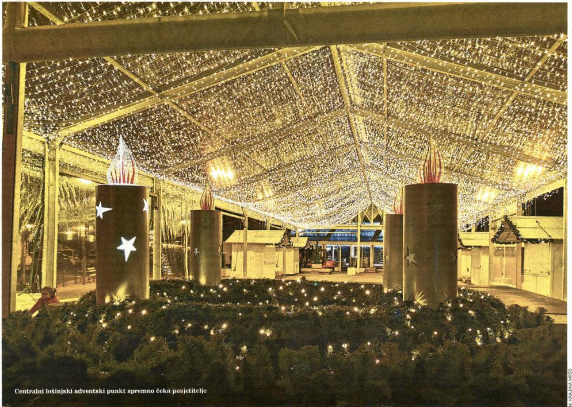
Centralni lošinjski adventski punkt spremno čeka posjetitelje