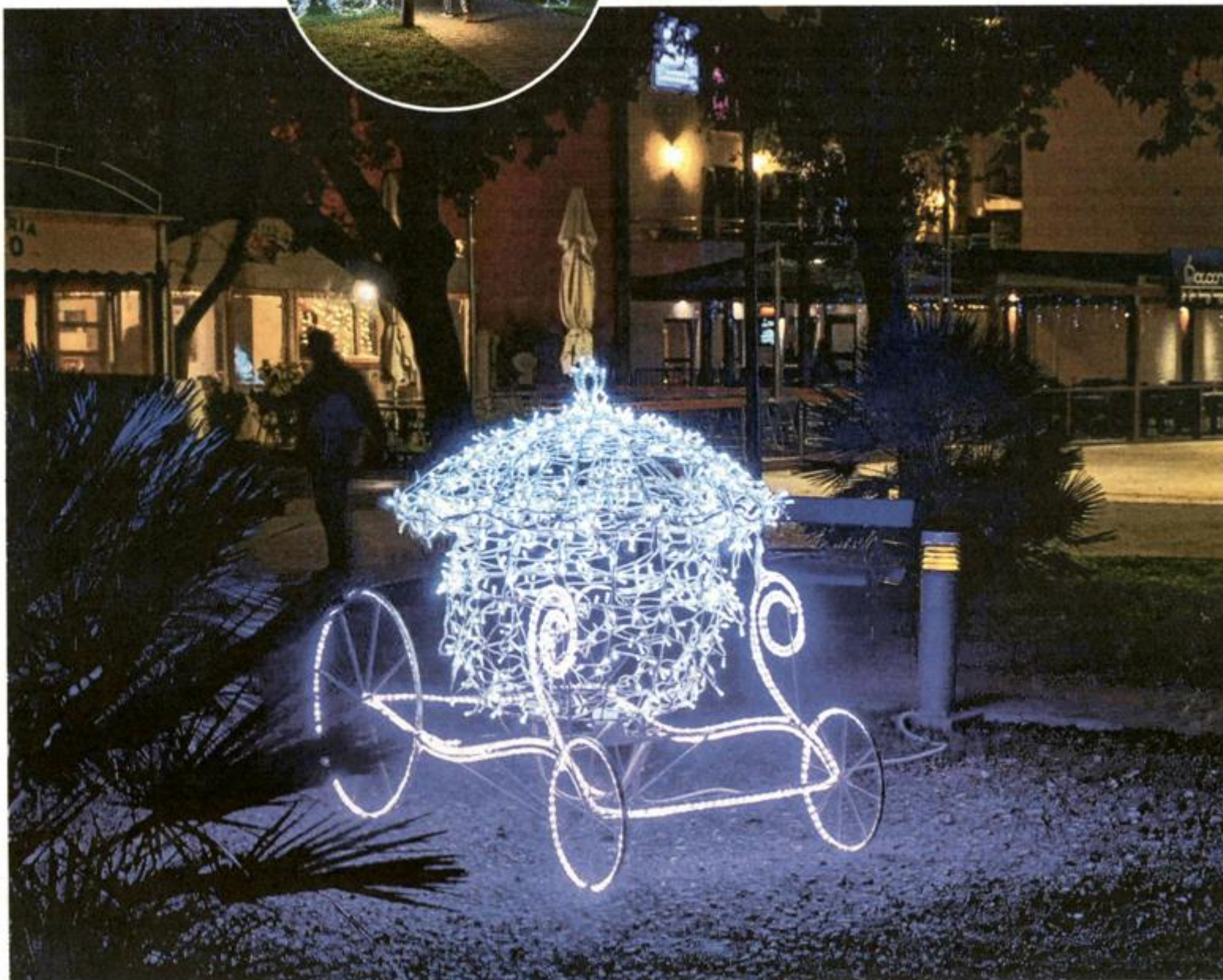
Punat bogato ukrašen ušao u doba adventa

Novogodišnji blagdani ponovo će otvoriti dio smještaja na otocima. Jedan od hotela u kojem su tradicionalno jako okrenuti na advent i dočeka Nove godine je hotel Malin u Malinskoj. Ondje, primjerice, ponovo organiziraju dane bakalara od 7. do 24. prosinca, a kroz čitavo to vrijeme imaju nastupe klapa i glazbenih sastava. Već poznati po novogodišnjim dočecima, i ove godine nude nekoliko »tipova« dočeka. Pa će tako tu biti Young&fun New Year, koji u all inclusive aranžmanu stoji 550 kuna po osobi. Oni malo »ozbiljniji« mogu se odlučiti za Royal New Year u restoranu Royal hotela. Uz večeru uz sedam sljedova i živu glazbu, ovaj će doček stajati 590 kuna po osobi. Isto toliko stoji i Classic New Year, a da ni najmanji ne bi bili zakinuti, tu je i Kids New Year. Cijena dječjeg dočeka je 200 kuna po djetetu i uključuje zabavu uz animatora, karaoke, kreativnu radionicu rekvizita za drvce, veselo fotkanje, puštanje balona želja, novogodišnju zdravicu te uživanje u zalogajčićima. Eto, što reći, ponešto za svakoga.