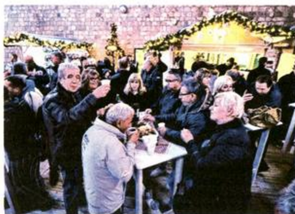
Ugostiteljska ponuda privlači i otočane i goste

I Pažani se već nekoliko godina trude učiniti adventsko razdoblje što privlačnijim. Dok su novaljska silvestrova već na daleko poznata, prvenstveno po jakim estradnim imenima i odličnom štimungu, Grad Pag oćarava ambijentom, ugođajem i brojnim sadržajima - od klizanja do fešti u II Magazinu soli. Pažani su ove godine nabavili nove ukrase i dekoracije s kojima je ukrašen cijeli grad, kao i II Magazin soli kako bi građani i posjetitelji uživali u čarobnom ugođaju, a TZG Paga zajedno s udrugama i gradskim institucijama objedinio je program do kraja adventa. Novost su i dva velika svijetleća snjegovića na predjelu Katine i Trgu Petra Krešimira IV. Svakog dana od do 6. siječnja, održavat će se koncerti, radionice, priredbe, predavanja i sportska događanja na raznim lokacijama u gradu, a novost je Škola klizanja za djecu i mlade.