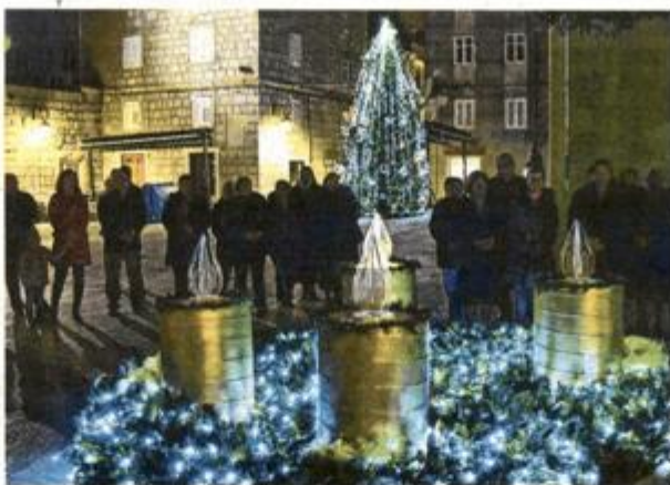
Paljenje prve adventske svijeće u Pagu