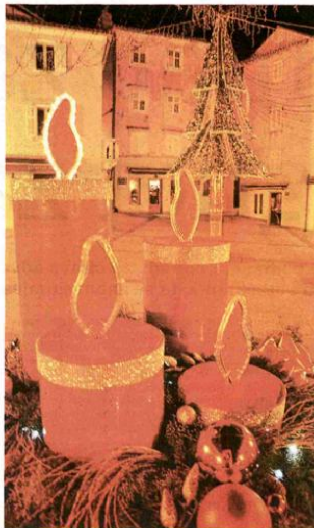
Adventska bajka na krčki način

- Smještajni objekti koji su na Lošinju otvoreni za novogodišnji doček su Hotel Aurora u Malom Lošinju i Hotel Televrin u Nerezinama, ali i dva kampa. Riječ je o kampovima Čikat i Poljana u Malom Lošinju, a idealan boravak može se provesti i u brojnom privatnom smještaju u čemu će pomoći lokalne turističke agencije. Za zatvorene grupe otvoreni će biti Vitality Hotel Punta i Family Hotel Vespera. S obzirom na bogati program adventa i doček Nove godine na glavnom gradskom trgu uz Petra Grašu, u očekujemo veći broj gostiju iz Slovenije i Hrvatske, najveći broj gostiju dolazi iz Austrije, zatim slijede Slovenci, Nijemci, Hrvati i Talijani, najavio je Dalibor Cvitković, direktor Turističke zajednice grada Malog Lošinja te istaknuo kako goste na Lošinju i ove godine očekuje najljepša božićna priča uz zanimljiv božićni i novogodišnji provod te mnoštvo iznenađenja. Uz klizalište, centar Malog Lošinja ove godine dobiva novo ruho pa će tako uz jaslice i