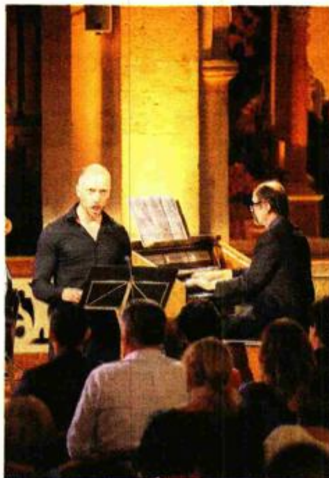
Na festivalu nastupaju vrhunski domaći i strani glazbenici

Što se tiče opstanka suvremene glazbe na festivalu, primjetan je višegodišnji snažan trend intelektualizacije glazbe. Cijeneći važnost napredovanja u klasičnoj glazbi, smatram da je jednako važno da glazba ostane dostupna svima. Osorske glazbene večeri trebaju postati ekskluzivan poligon za promociju novih i afirmiranih skladatelja s djelima koja duboko utječu na ljudske emocije i promiču ljepotu, dobrotu i istinitost – poručio je Mihanović.