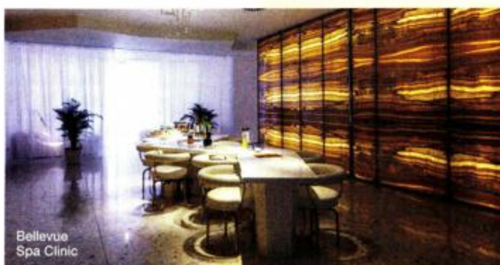
Bellevue Spa Clinic