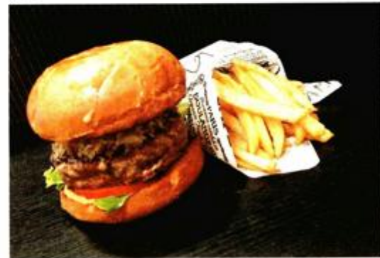
Otočni fast food: burger s domaćom janjetinom, povrćem i krumpirićima