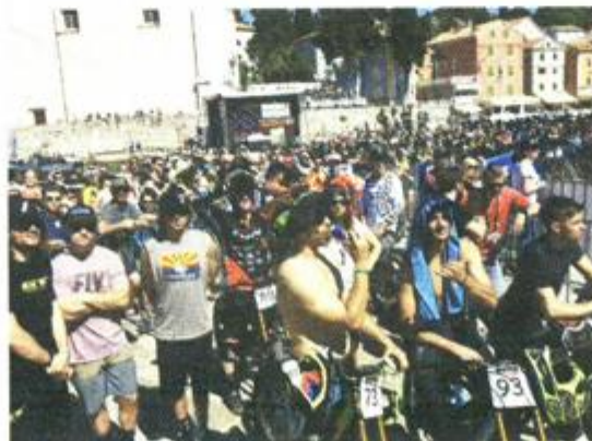
Fan zona s velikim ekranom s kojeg su učesnici i navijači mogli pratiti spuštanje