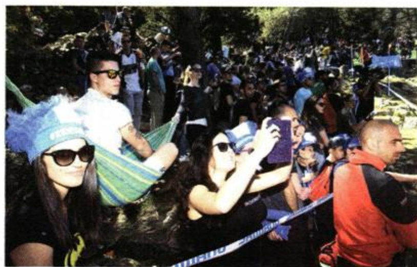
Publika pomno pratila vratolomije na stazi