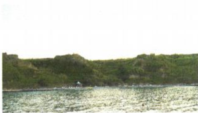
Na plaži je nekad bilo liječilište