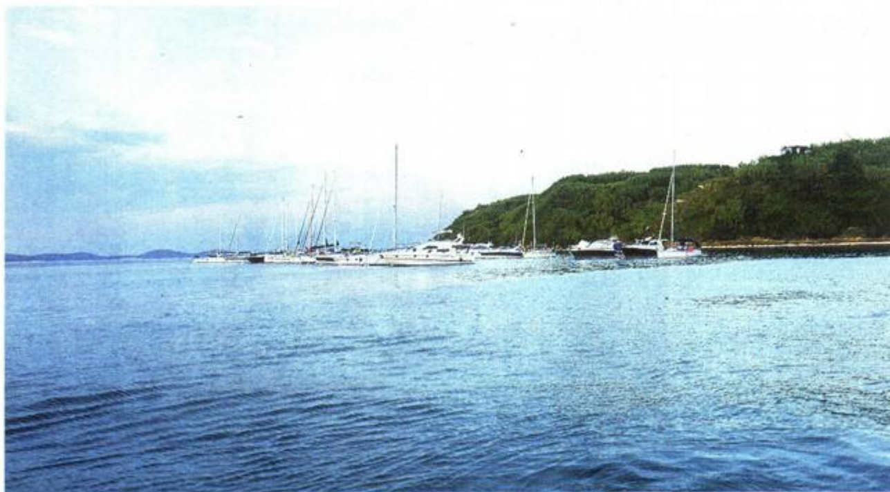
Nautičari rado dolaze na Susak