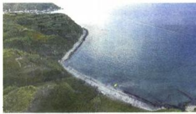
Otok Susak pokriven je trstikom

Poseban otok, negdje na kraju. Nema više otoka nakon njega, samo pučina. Nema prometnica, nema automobila. Tek brodovi i katamarani