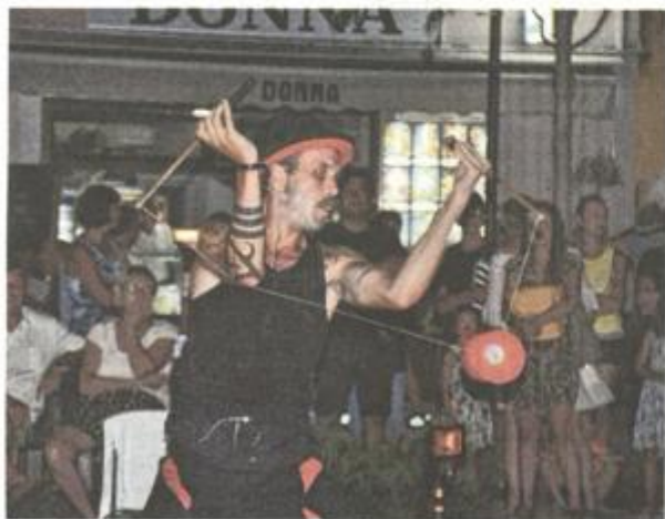
El Diablero u akciji

Organizator festivala je TZG Crikvenice, suorganizator agencija Zeitenwandler, a pokrovitelji Grad i ŽLU Crikvenica te Eko Murvica.